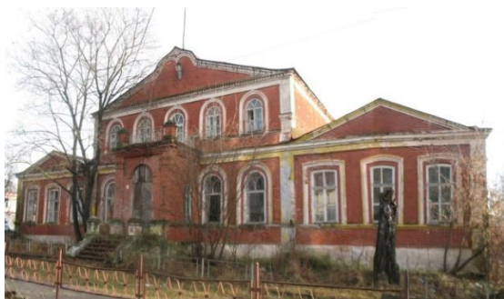
Рис. 7. 2008 г. Бывшая Земская аптека