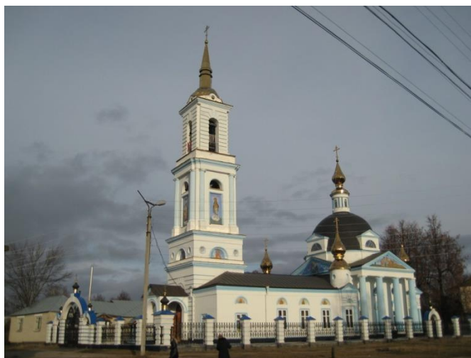
Рис. 3. 2008 г. Успенская церковь