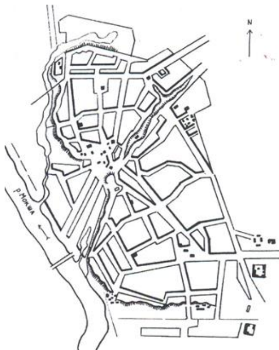
Рис. 1. Темников в первые годы существования (реконструкция А. Г. Нечаева на основе плана города XVIII в.)

В начале XXI века Темников создает образ малого города со своей историей, несмотря на то, что многие древние памятники архитектуры не сохранились до наших дней. Его живописный неповторимый облик виден еще на подъезде. Красивая панорама сочетает силуэты Успенской церкви (рис. 3) и деревьев с извилистой гладью реки Мокши. Издалека можно увидеть ансамбль Санаксарского монастыря, расположенного в красивом уединенном месте (рис. 4).