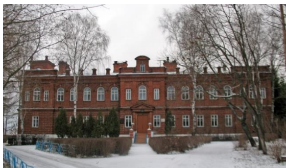
Рис. 8. 2008 г. Земская управа

Благоустройство многих частей города находится в плохом состоянии. В основном только центральная улица заасфальтирована, а прилегающие к ней дороги сменяются грунтовым покрытием. Среди жилых домов между ул. Октябрьская и Дорофеева можно увидеть кладбище, раньше оно было на окраине с северной стороны, но со временем застроилось вокруг. Город очень тихий и спокойный, что свойственно малым городам, транспорта мало, здесь люди привыкли ходить пешком. Набережная реки Мокши и существующий небольшой парк и скверы заброшены и не ухожены [6]. Старый железобетонный мост давно разрушен, сохранились лишь сваи (рис. 9). Чуть выше по течению реки есть небольшой пешеходный мост.