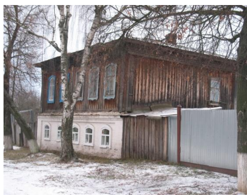
Рис. 5. Фото Ботиной О. А. 2008 г. Двухэтажный жилой дом

Центр, сохранивший очертания площади, включает купеческие двухэтажные дома (рис. 5), деревянные постройки. К историческому наследию, дошедшему до наших времен, относят здание историко-краеведческого музея, посвященного древней и современной истории города и, конечно, адмиралу Ф. Ф. Ушакову (рис. 6); бывшую Земскую аптеку (рис. 7), Земскую управу (рис. 8), Уездное мужское училище, Земскую больницу и др.