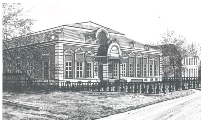
Рис. 6. Ботиной О. А. 2008 г. Историко-краеведческий музей