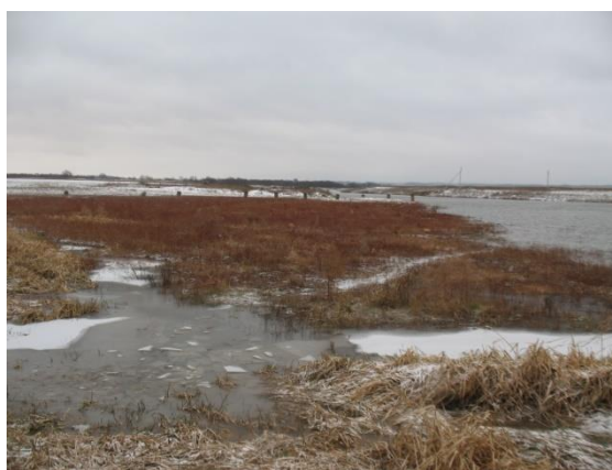
Рис. 9. 2008 г. Сваи старого железобетонного моста

Благоустройство многих частей города находится в плохом состоянии. В основном только центральная улица заасфальтирована, а прилегающие к ней дороги сменяются грунтовым покрытием. Среди жилых домов между ул. Октябрьская и Дорофеева можно увидеть кладбище, раньше оно было на окраине с северной стороны, но со временем застроилось вокруг. Город очень тихий и спокойный, что свойственно малым городам, транспорта мало, здесь люди привыкли ходить пешком. Набережная реки Мокши и существующий небольшой парк и скверы заброшены и не ухожены [6]. Старый железобетонный мост давно разрушен, сохранились лишь сваи (рис. 9). Чуть выше по течению реки есть небольшой пешеходный мост.