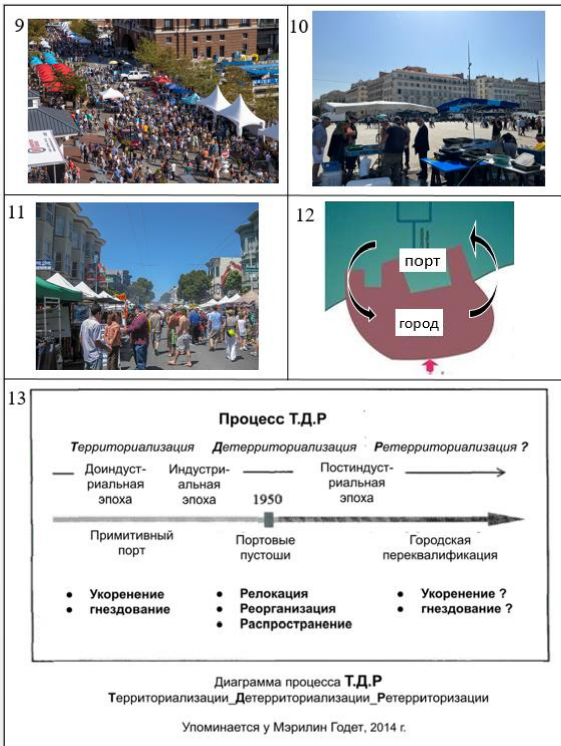
Рис. 9. "Festival Market Place" в старом порту Балтимора; рис. 10. "Festival Market Place" в старом порту Марсель; рис. 11. "Festival Market Place" в старом порту Сан-Франциско; рис. 12. Интеграция города и порта; рис. 13. Эволюция процесса ТДР во времени