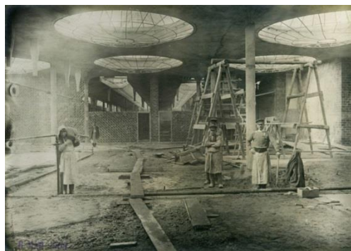
Рис. 3, 4. Новоткацкий корпус Богородско-Глуховской мануфактуры в с. Глухово. Продольные и конические шеды

Такие типы интерьеров по причине их редкости, нестандартности инженерно-технических, объемно-пространственных, конструктивных и композиционно-художественных решений, бесспорно, ценны и, несомненно, должны полностью сохранять свой облик.