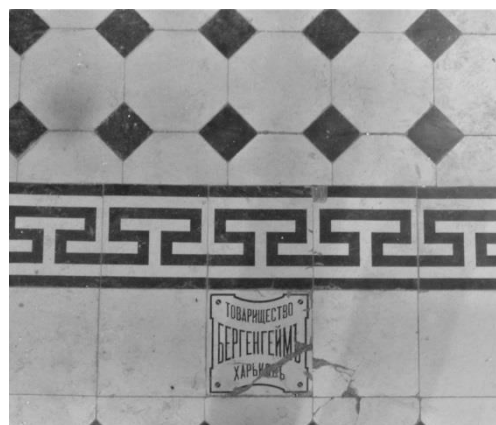
Рис. 2. Метлахская плитка в электростанции отделочного корпуса Товарищества Покровской мануфактуры П. Н. Грязнова в г. Иваново-Вознесенске.

Вместе с тем при рассмотрении целесообразности охраны исторических производственных зданий вопрос ценности (а, значит, и сохранения) этой системы весьма полемичен.