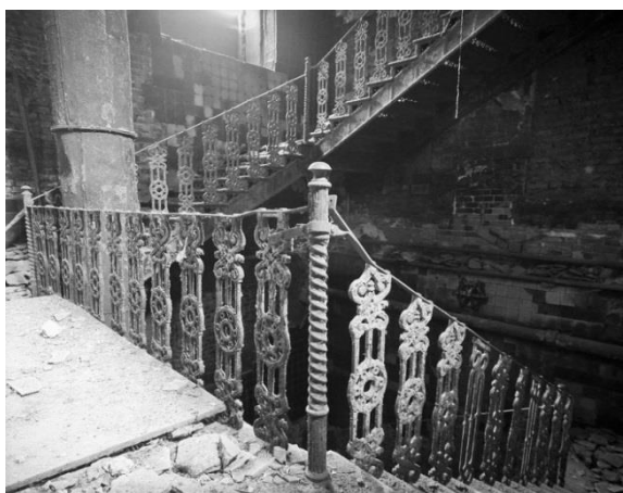
Рис. 1. Металлическая лестница на текстильной фабрике Малютиных в г. Раменское [https://4stor.ru/zabroszki/95075-zabroszhennyy-ceh-tekstilnoy-fabriki.html]

Исторические промышленные здания представлены широким набором их типологии. Но если принципы объемно-планировочных построений производственных помещений (ячейково-зальная, пролетная, зальная структуры) применяются до сих пор, то многие конструктивные решения давно ушли в «небытие» и сегодня уже не применяются. Так, например, металло-кирпичная система с их чугунными колоннами и сводами по металлическим балкам – уже давно история [2]. Редко применяется для ячейково-зальных пространств и монолитный железобетон. Тем не менее практически более 50 % действующих предприятий текстильной и швейной промышленности располагаются в корпусах более чем вековой постройки, где сохранились аутентичные объемно-планировочные решения, конструкции (металлические, монолитные железобетонные колонны, лестницы) и отделочные материалы (метлахская плитка на полах). Эти конструкции и материалы в их незамаскированном виде и составили основу художественной системы производственных интерьеров (рис. 1, 2).