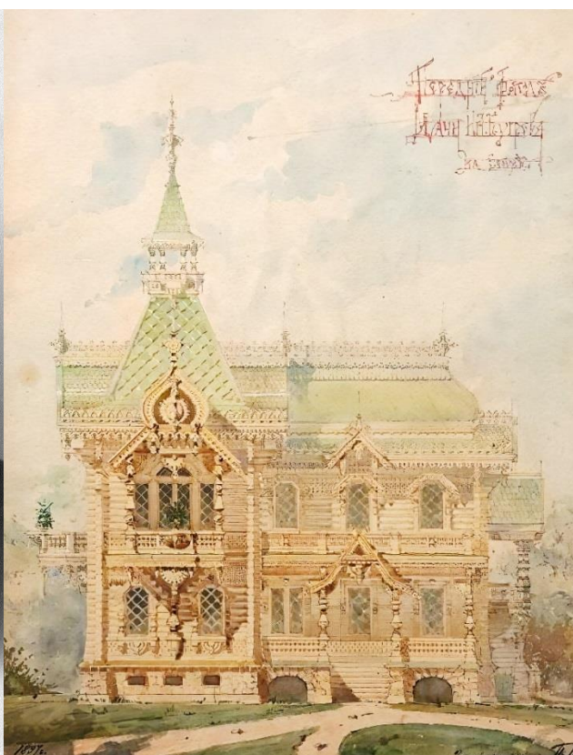
Рис.3. Передний фасад дачи Н.А. Бугрова. Акварель арх. П.П. Малиновского. 1897 г.