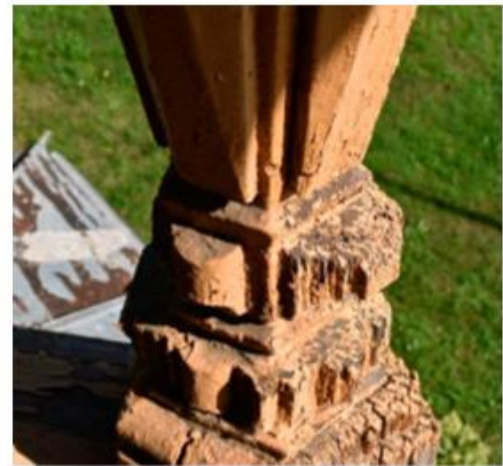
Рис.4. Состояние до реставрации