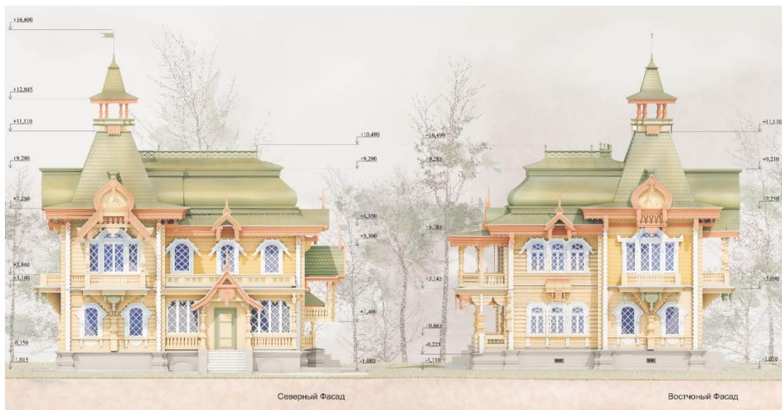
Рис. 5. Проект реставрации. Фасады.