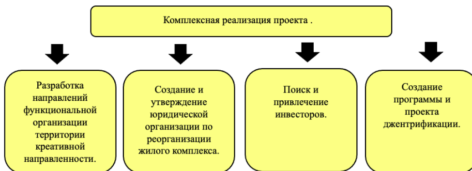
Рис. 3. Алгоритм внедрения принципов джентрификации для жилых комплексов города Константин