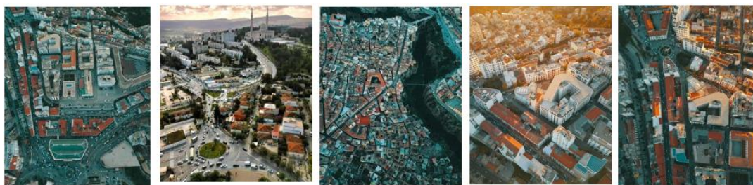
Рис. 1. Примеры жилых комплексов территорий города Константин 2016