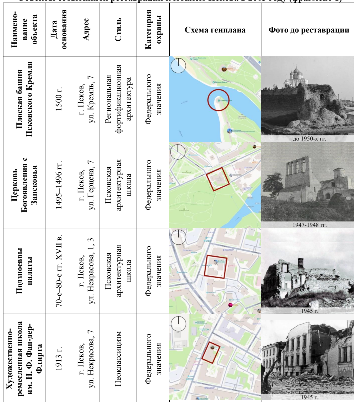
Объекты событийной реставрации к юбилею Пскова в 2003 году (фрагмент 1)