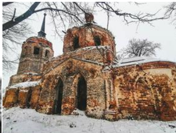
Рис. 7. Храм Великомученицы Екатерины, ур. Алферьево (1800–1820 гг.)