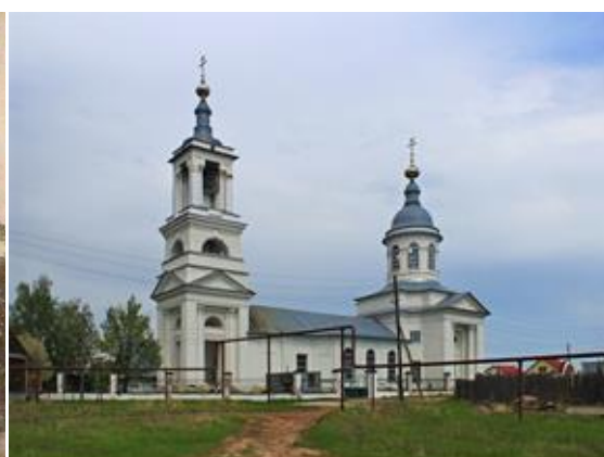
Рис. 5. Храм Живоначальной Троицы, п. Досчатое (1798–1809 гг.)