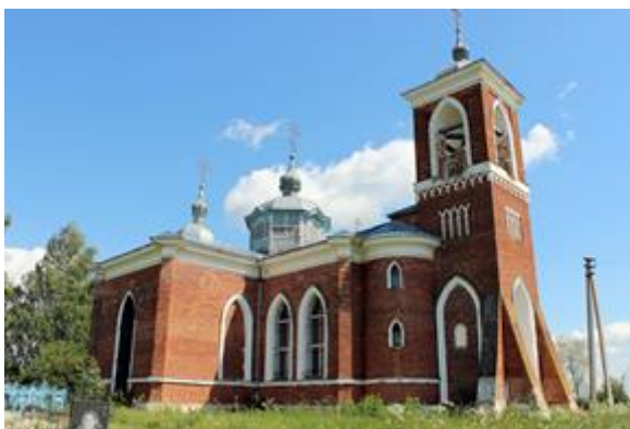
Рис. 2. Храм иконы Божией Матери «Знаменье», с. Луговое (прим. 1838 г.)