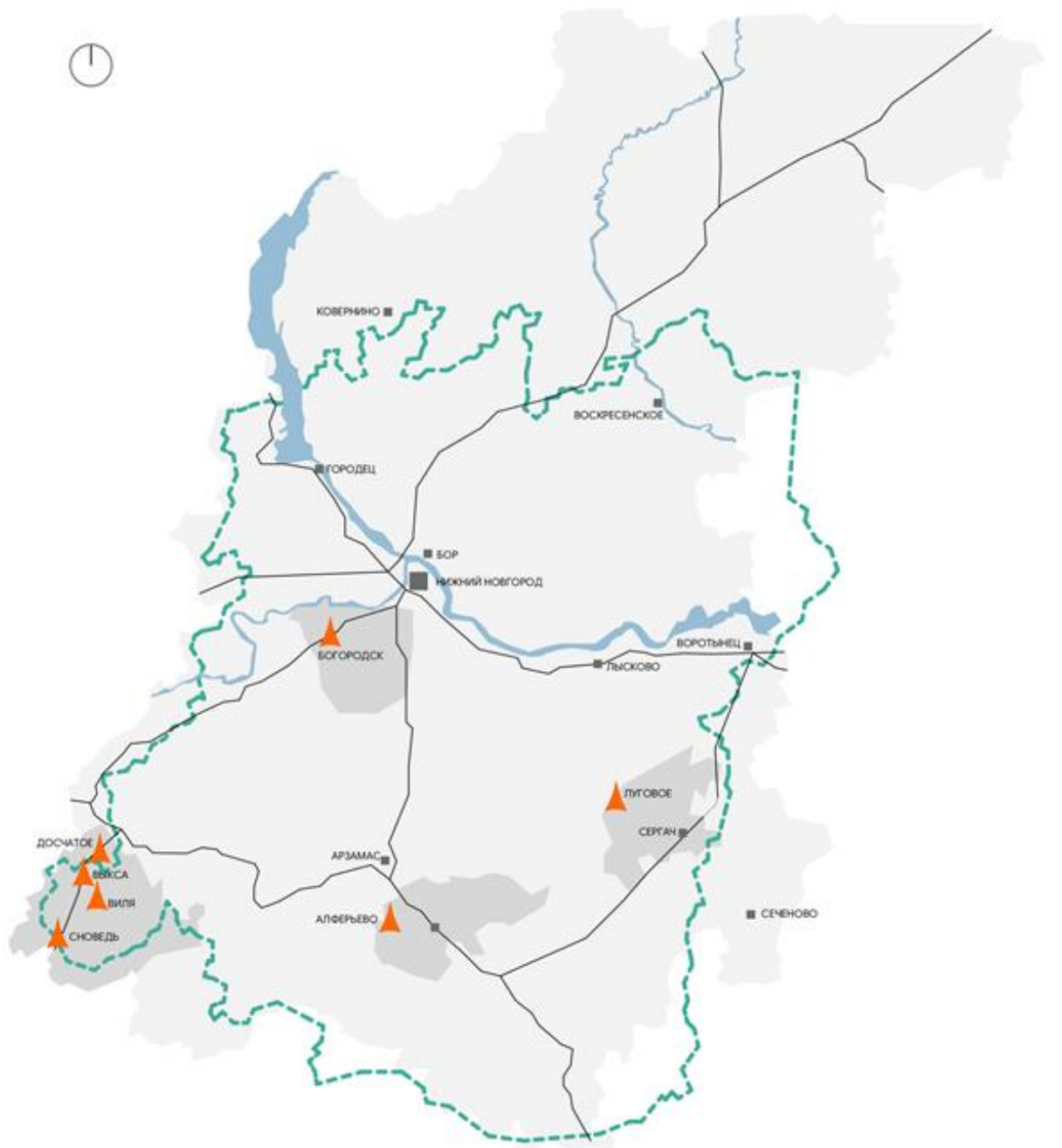
Рис. 1. Карта-схема Нижегородской области с населенными пунктами, содержащими исследуемые «готические» храмы

Обратимся к этим объектам, чтобы выявить их особенности (рис. 3–5). Первой в ряду строительства была церковь Иоанна Богослова (изначально освящена в честь Рождества Пресвятой Богородицы) в Выксе (1797–1799 гг.). До перестройки это был ротондальный храм со ступенчатым купольным завершением и крестообразно расположенными выступами в плане, продольное направление выявлялось расположенной двухъярусной колокольной, что можно увидеть на фиксационных чертежах [10, 11]. Объемы при всей чистоте классицистического построения и пропорциональной стройности памятника