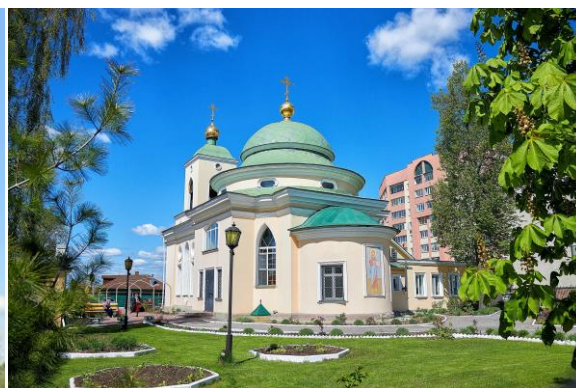
Рис. 3. Храм Рождества Пресвятой Богородицы, г. Выкса (1797–1799 гг.)