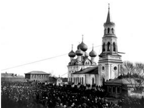
Рис. 6. Успенский храм, г. Богородск (?–1816 гг.), Фото 1930-х гг. (?)