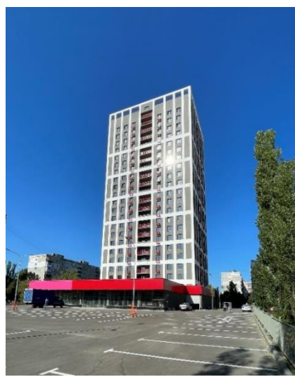
Рис. 9. ЖК «Кипарис» (ТМА Быкова)