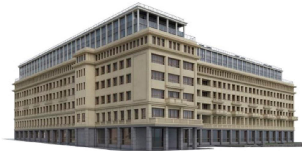
Рис. 11. ЖК «Георгиевский» (НПО «Архстрой»