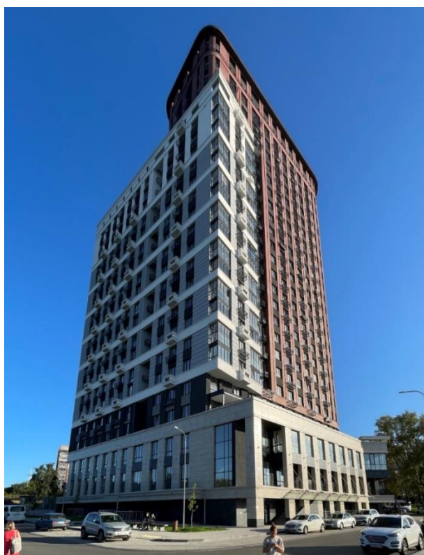
Рис. 4. ЖК «Дом на набережной» («Золотое сечение» и АБ «Гора»)