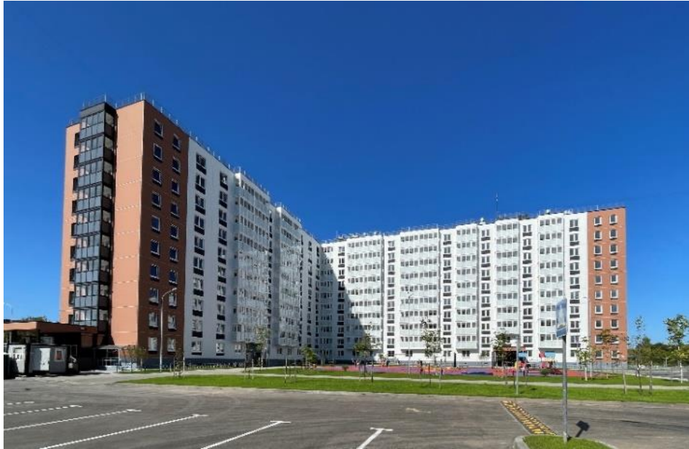
Рис. 10. ЖК «Торпедо» (ПК ГОРПРОЕКТ)