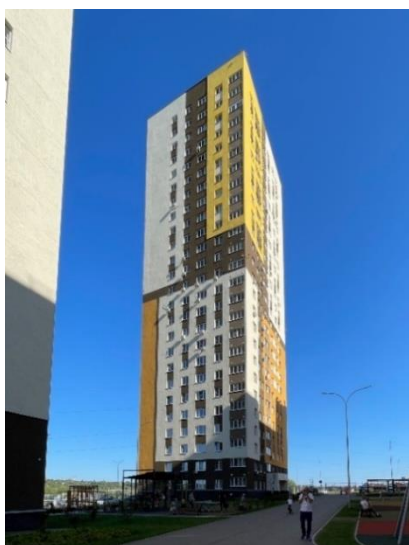
Рис. 6. ЖК «Новая Кузнечиха» (ТМА Быкова)