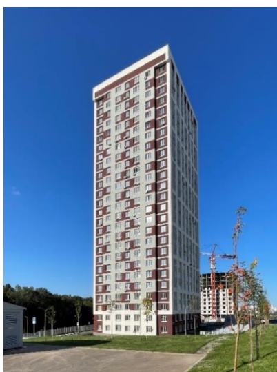
Рис. 8. ЖК «Цветы-2» (АБ «Линия»)