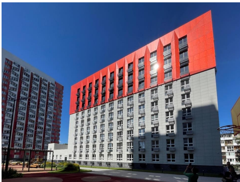
Рис. 2. ЖК «Дом на Краснозвездной» (Проектная компания «ГОРПРОЕКТ»)