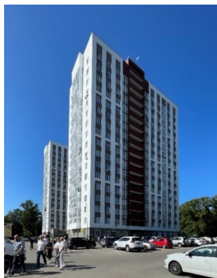
Рис. 7. ЖК «Заречье» (ПК ГОРПРОЕКТ)