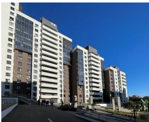
Рис. 5. ЖК «Корица»