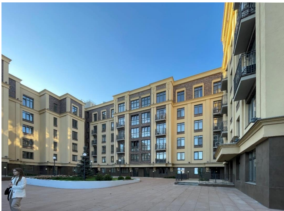
Рис. 3. ЖК «Шляпин» (НПО «Архстрой»)