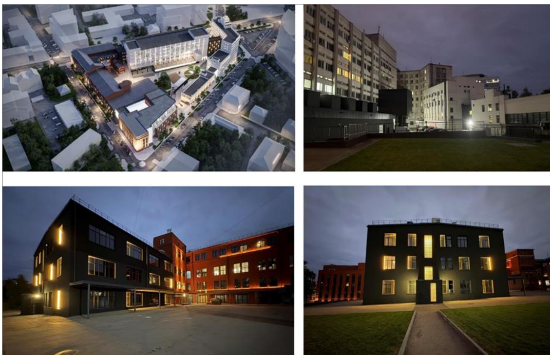
Рис. 4. Образовательный, промышленный и креативный кластер «Нижполиграф» в Нижнем Новгороде. Проект реконструкции комплекса, ИРГСНО, ab Plombir , 2020–2025. Фото А. Гельфонд, 2025