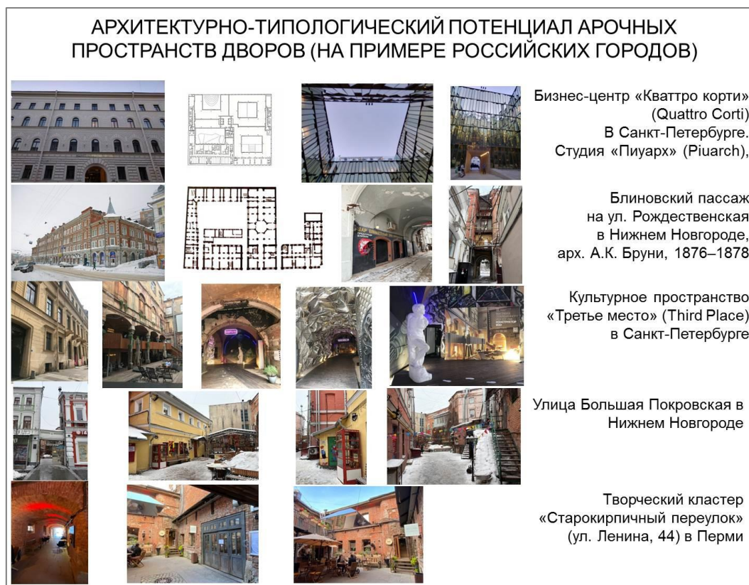
Рис. 2. Архитектурно-типологический потенциал арочных пространств дворов