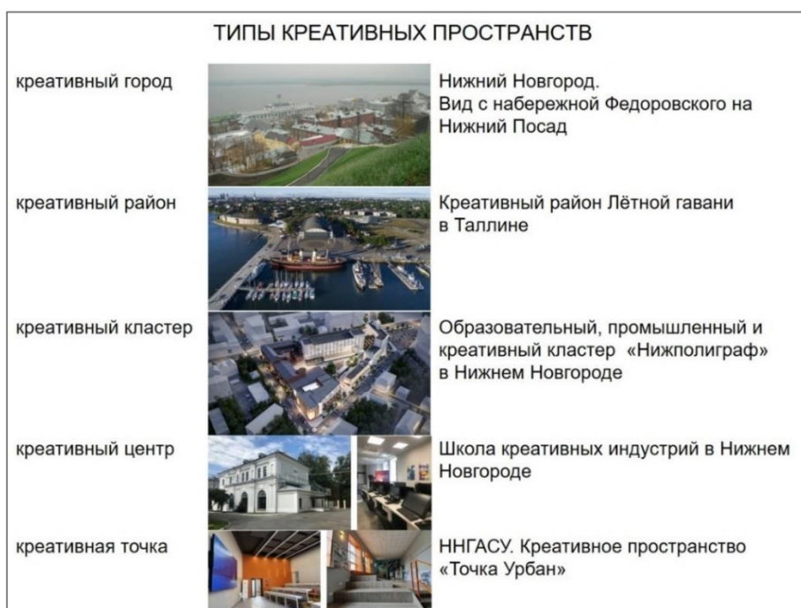
Рис. 1. Типы креативных пространств