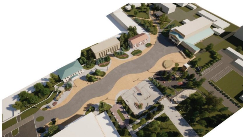
Рис. 6. Центральная площадь, перспективный вид сверху. Визуализации – Наумов К.