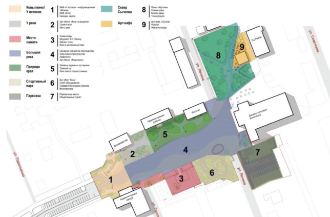
Рис. 4. Концептуальное зонирование пространства Центральной площади и прилегающих территорий. Арх. О. А. Ботина, О. А. Родина, В. М. Уморина, А. В. Чеграва: 1 – У истоков; 2 – У реки; 3 – Место памяти; 4 – Большая река; 5 – Природа края; 6 – Спортивный парк; 7 – парковка; 8 – сквер Сычкова; 9 – Арт-кафе.