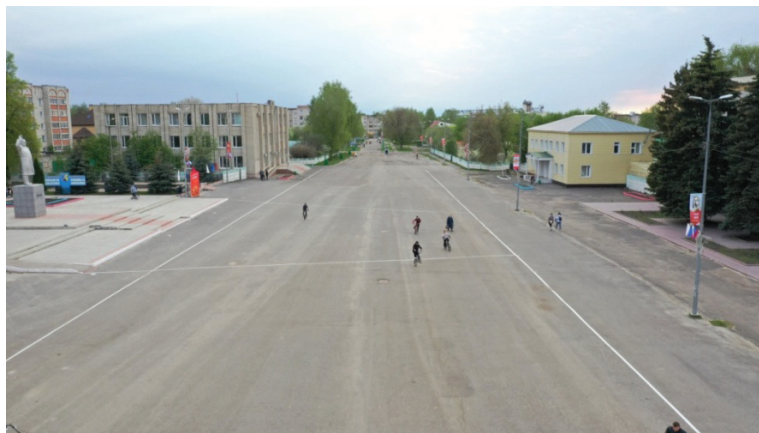
Рис. 1. Центральная площадь, г. Ковылкино, 2022 г.