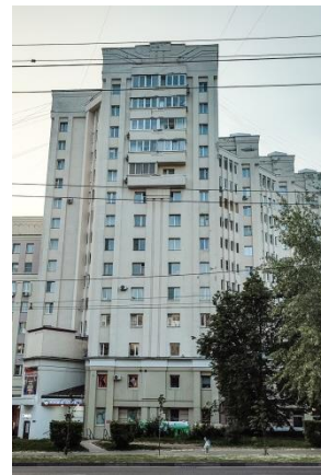
Рис. 8. Многоэтажный жилой дом на пр-кт Ленина, 38, 2003 г.