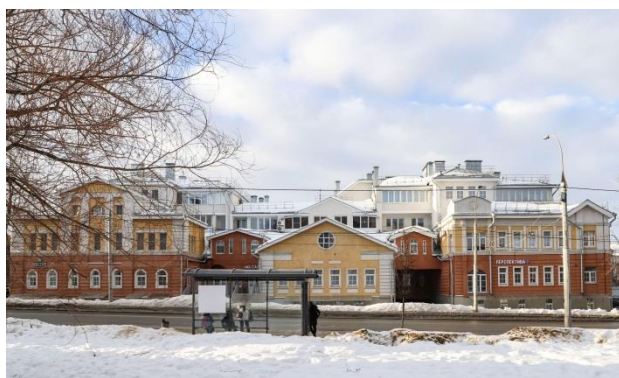
Рис. 3. здание по ул. Б. Нижегородской, 27, 2017 г.