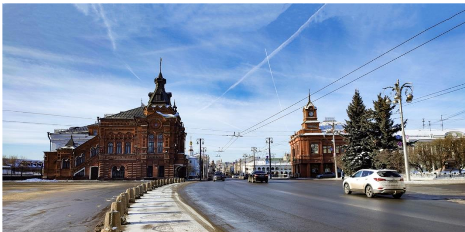
Рис. 9. Здание Городской думы (арх. Я. Г. Ревякин), 1907 г. (слева) и здание банка по ул. Б. Московской, 27 (арх. В. С. Петров), 1995 г. (справа)