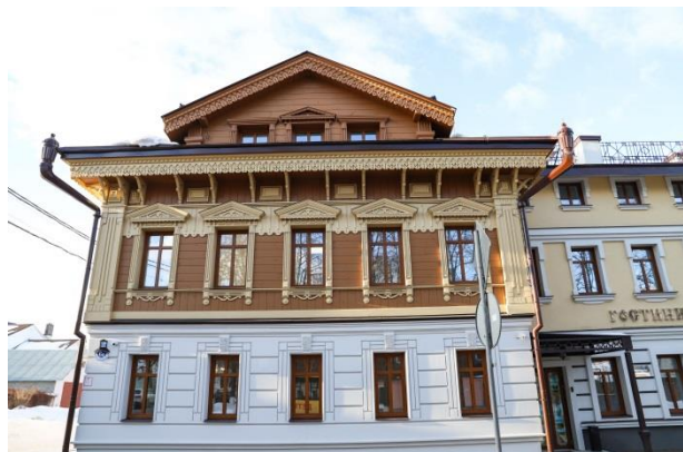
Рис. 1. Здание гостиницы по ул. Чехова, 6А, 2004 г.