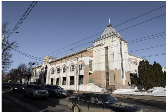
Рис. 7. ТЦ «Русский дом» по ул. Б. Нижегородской, 49, автор концепции – арх. А. Б. Богаченко, 2014 г.