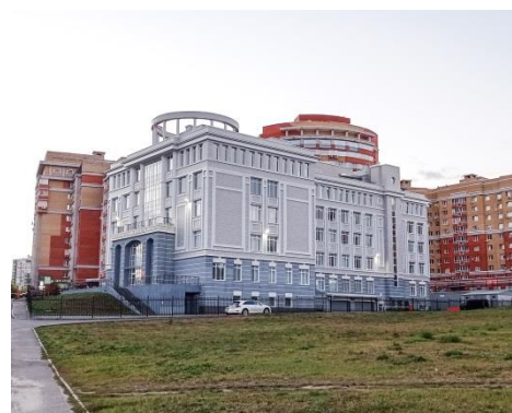
Рис. 4. Здание арбитражного суда Владимирской области, 2021 г.