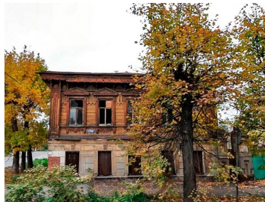
Рис. 2. Утраченный жилой дом по ул. Герцена, 13