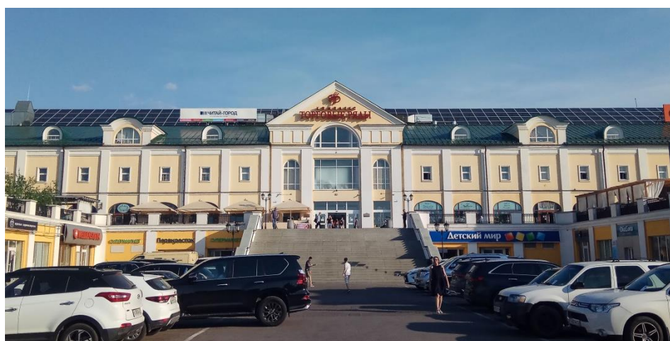
Рис. 5. Северные торговые ряды, АО «Владимирреставрация», 2006 г.