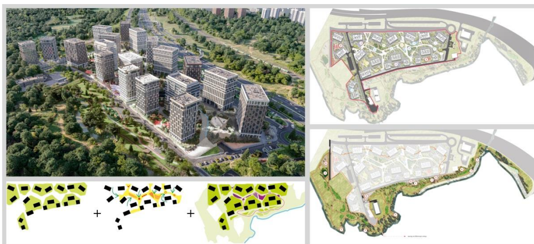
Рис. 6. Двор-Парк. ЖК «West Garden», арх. бюро «SPEECH (СПИЧ)» (проектировщик), ландшафтная компания «Arteza» (концепция благоустройства), бюро «Дружба» и «Чехарда» (разработка площадок), компания «ИНТЕКО» (девелопер), г. Москва, пойма р. Раменка, 2021 г.