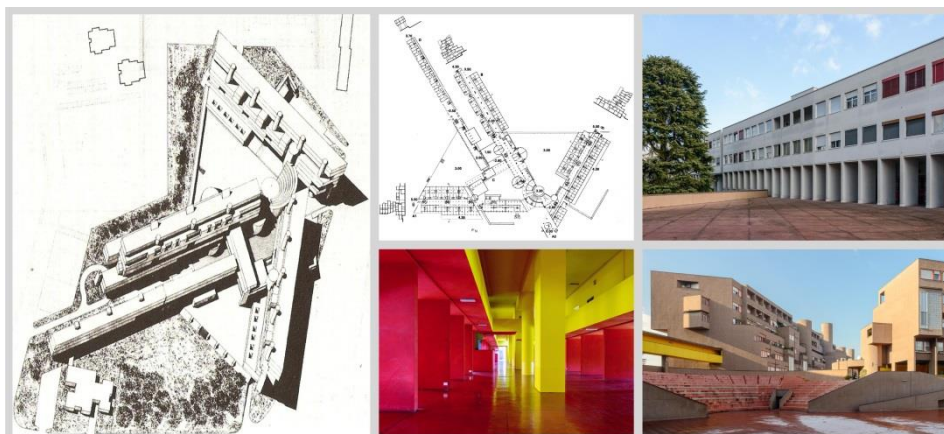
Рис. 1. Двор-Дом. Жилой комплекс «Монте Амиата», Италия, г. Милан, район Галаратезе 2, арх. Карло Аймонино (арх. студия «Aude») и арх. Альдо Росси, конец 1960-х гг.