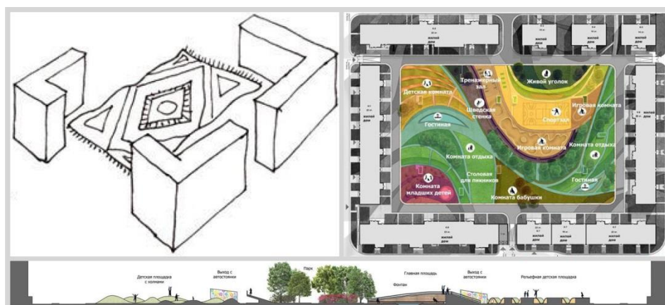
Рис. 2. Двор-Квартира. Концептуальный проект «Двор – это квартира для всех», г. Москва, арх. компания «REFLECTION», 2017 г.