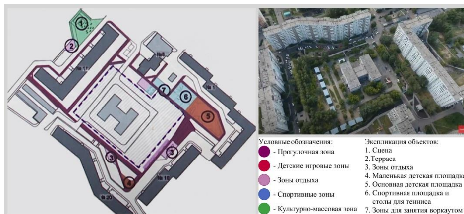
Рис. 3. Двор-Бульвар (1). Проект благоустройства «Двор-Бульвар», ул. Славы, 1, мкр-н Солнечный, г. Красноярск, инициативное бюджетирование (жители мкр-на и управляющая компания «Новый город»), 2021 г.