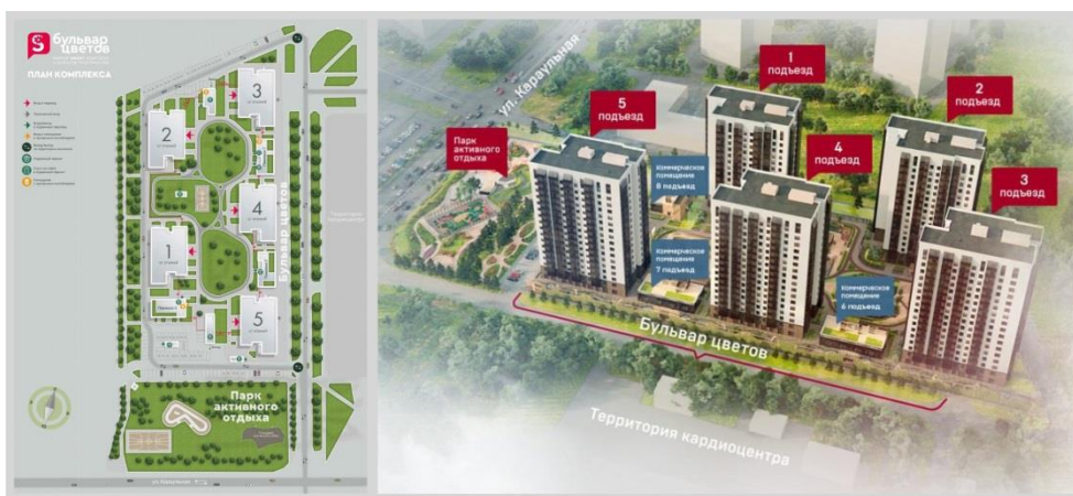
Рис. 4. Двор-Бульвар (2). Проект жилого smart комплекса «Бульвар цветов», ул. Караульная, 45, г. Красноярск, ГСК «Арбан», 2020 г.