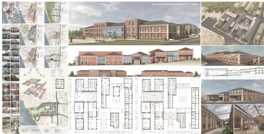
Рис. 1. Реконструкция торговых рядов в Городце под культурно-образовательный центр. ВКР бакалавра (автор Д. И. Нестеренко, 2019)