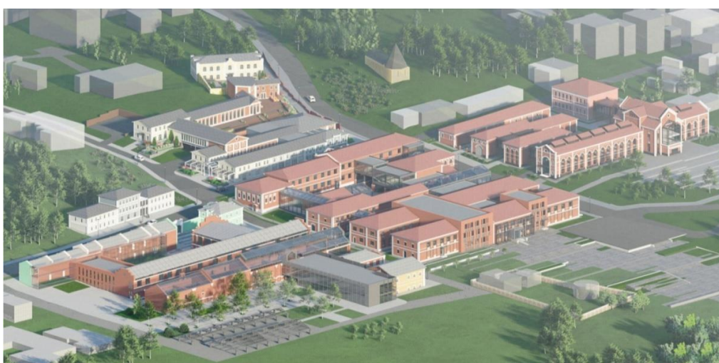
Рис. 5. Общественное пространство «Нижний базар», вид с северо-запада. Фрагмент ВКР магистра (автор А. А. Демина, 2022)