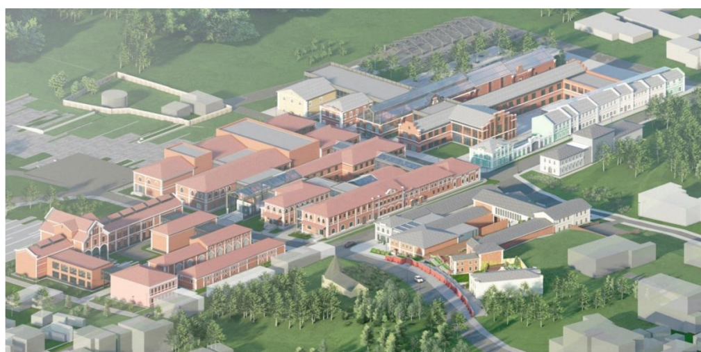
Рис. 6. Общественное пространство «Нижний базар», вид с юго-востока. Фрагмент ВКР магистра (автор А. А. Демина, 2022)