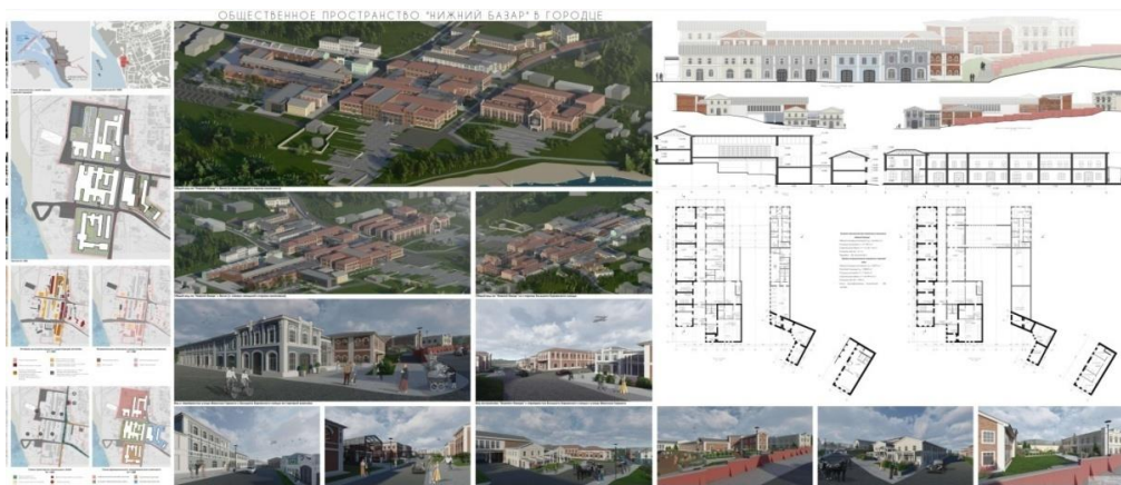
Рис. 4. Общественное пространство «Нижний базар» в Городце. ВКР магистра (автор А. А. Демина, 2022)