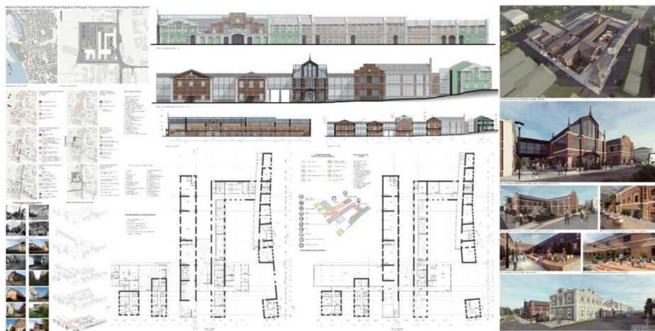
Рис. 2. Реконструкция торговых рядов в Городце под информационно-деловой центр. ВКР бакалавра (автор А. А. Демина, 2020)