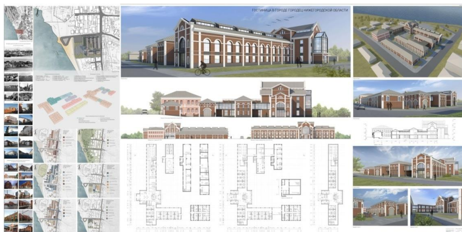
Рис. 3. Реконструкция торговых рядов в Городце под гостиничный комплекс. ВКР бакалавра (автор Д. П. Шешурина, 2021)